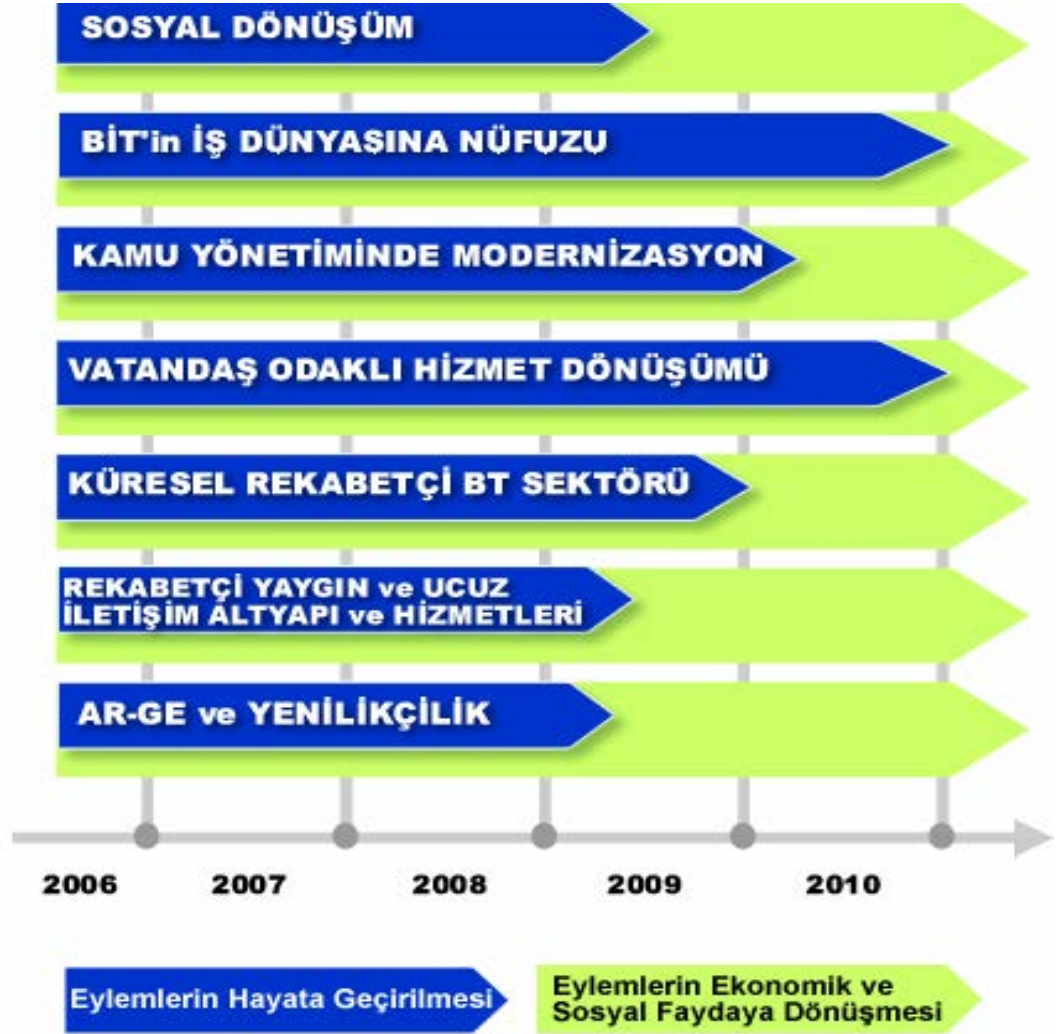
Şekil 3: Türkiye'nin Enformasyon Siyasetindeki Hedefleri (DPT, 2006: 41).

Enformasyon siyaseti içerisinde, her ne kadar Sencer Ailesi'nin bir bilgisayara sahip olmasıyla birlikte başlayan sözde toplumsal dönüşüm gerçekte bu açıdan da eleştiriye oldukça açık bir kesit oluşturmuştur. Her ne kadar, enformasyon toplumu siyaseti ile bilgiye erişim hakkının tanınmadığı, kişisel verilerin korunmasına dair kanunun on yılı aşkın bir süredir beklediği, yeni medya okuryazarlığının gelişmemişliği ve yurttaşın gittikçe doğal karşılanan ölçüde tüketici kimliği ile tanınmasının yanı sıra sayısal eşitsizlik Türkiye için anlamlı bir sorun olarak