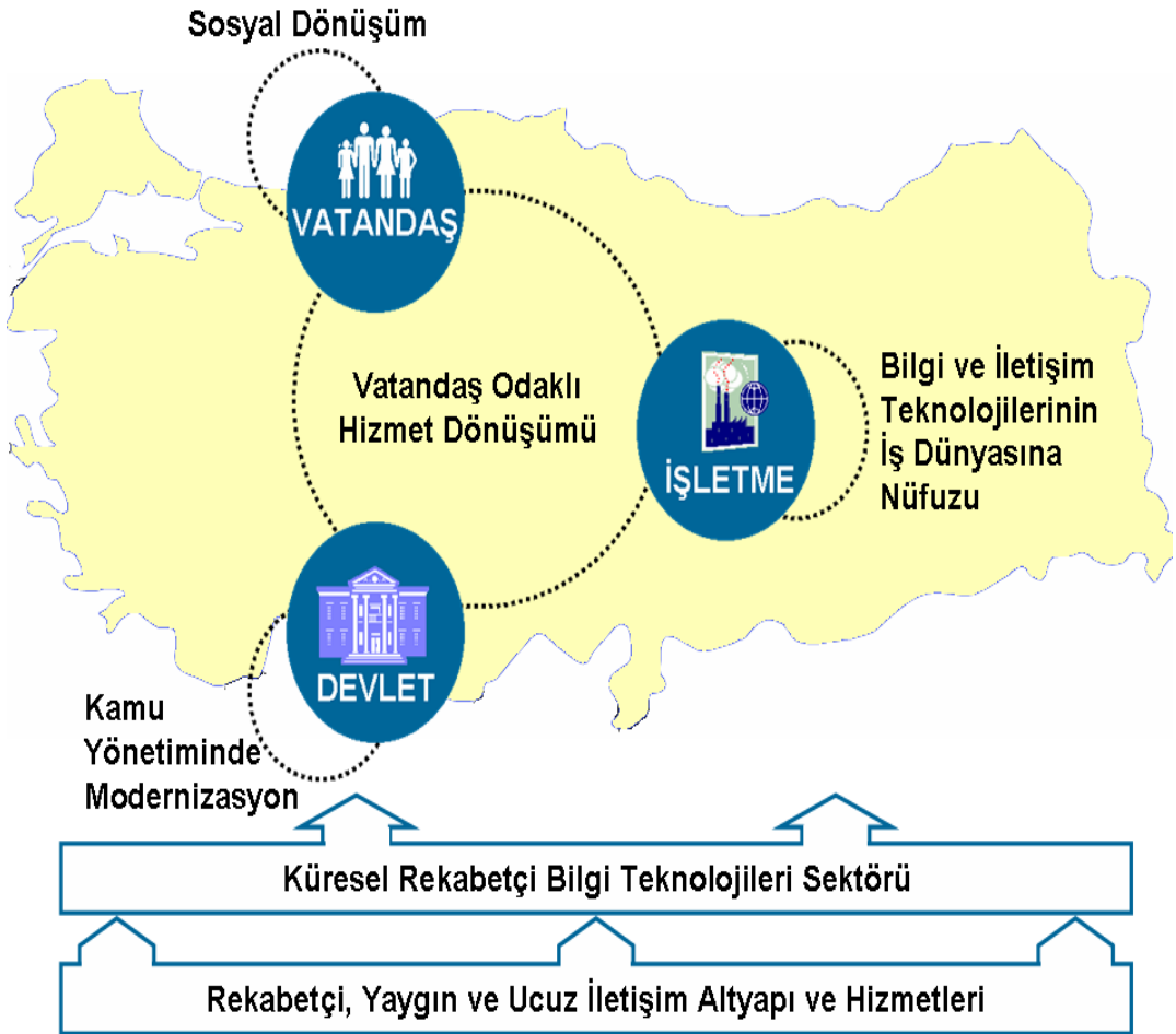
Şekil 2: Türkiye'nin Bilgi Toplumu Dönüşümü Öncelikli Alanlar ve Hedefler (DPT, 2006: 21).

Türkiye'nin siyaset gündemine üstelik "toplumsal dönüşüm" modeli ile birlikte aldığı enformasyon toplumu stratejisi; gerçekte yeni liberalizmin gelişmekte olan ülkelere dair açıklamalarını yeniden üretmektedir. Planın nerede ise tamamına